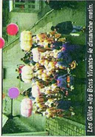
Les Gilles «les Bons Vivants» le dimanche matin.