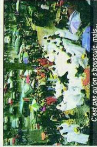
C'est pas qu'on s'bouscule, mais...