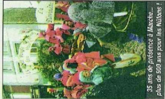
35 ans de présence à Marche... plus de 900 ans pour les Néitons !