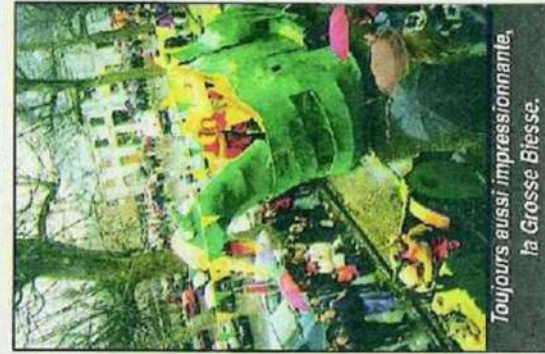
Toujours aussi impressionnante, la Grosse Biesse.