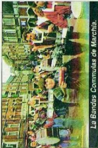
La Bandas Commulas de Marchia.