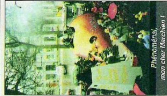
Phénoménal, mon cher Marchien !