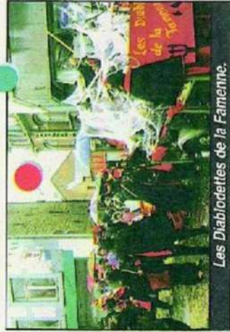
Les Diablotettes de la Faimenne.