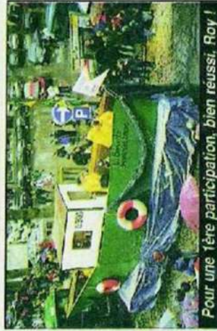
Pour une 1ère participation, bien réussi, Roy !