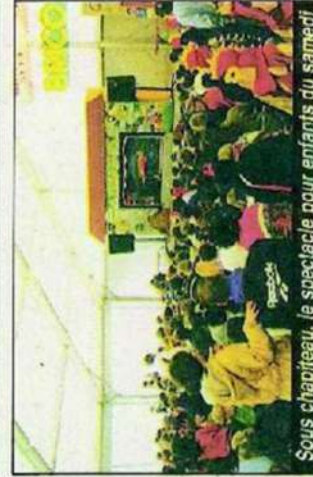
Sous chapiteau, le spectacle pour enfants du samedi