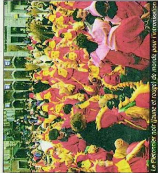
Le Piétonnier noir (jaune et rouge) de monde pour l'intronisation